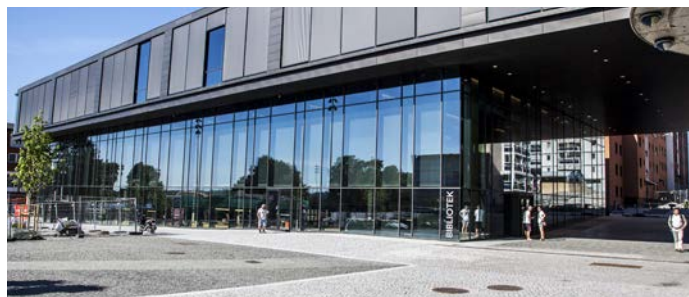
Nye hus: T.v: det nye Prøysenhuset skal stå klart 23.juli, på Prøysens bursdag. T.h: kulturhuset på Hamar brukes flittig av befolkningen.

Hamar kulturhus har vært frontet i media, både av motstandere og forkjempere i kulturhusdebatten. Huset holder høy teknisk standard og oppfyller alle krav både når det gjelder akustikk og øvingslokaler. Huset har brakt hele innlandet mer sammen og skaper en naturlig møteplass i byen på tvers av alder, bakgrunn og interesser. Medvirkning fra innbyggerne har hatt en sentral plass i byggeprosessen og folk både bruker og føler eierskap til huset.