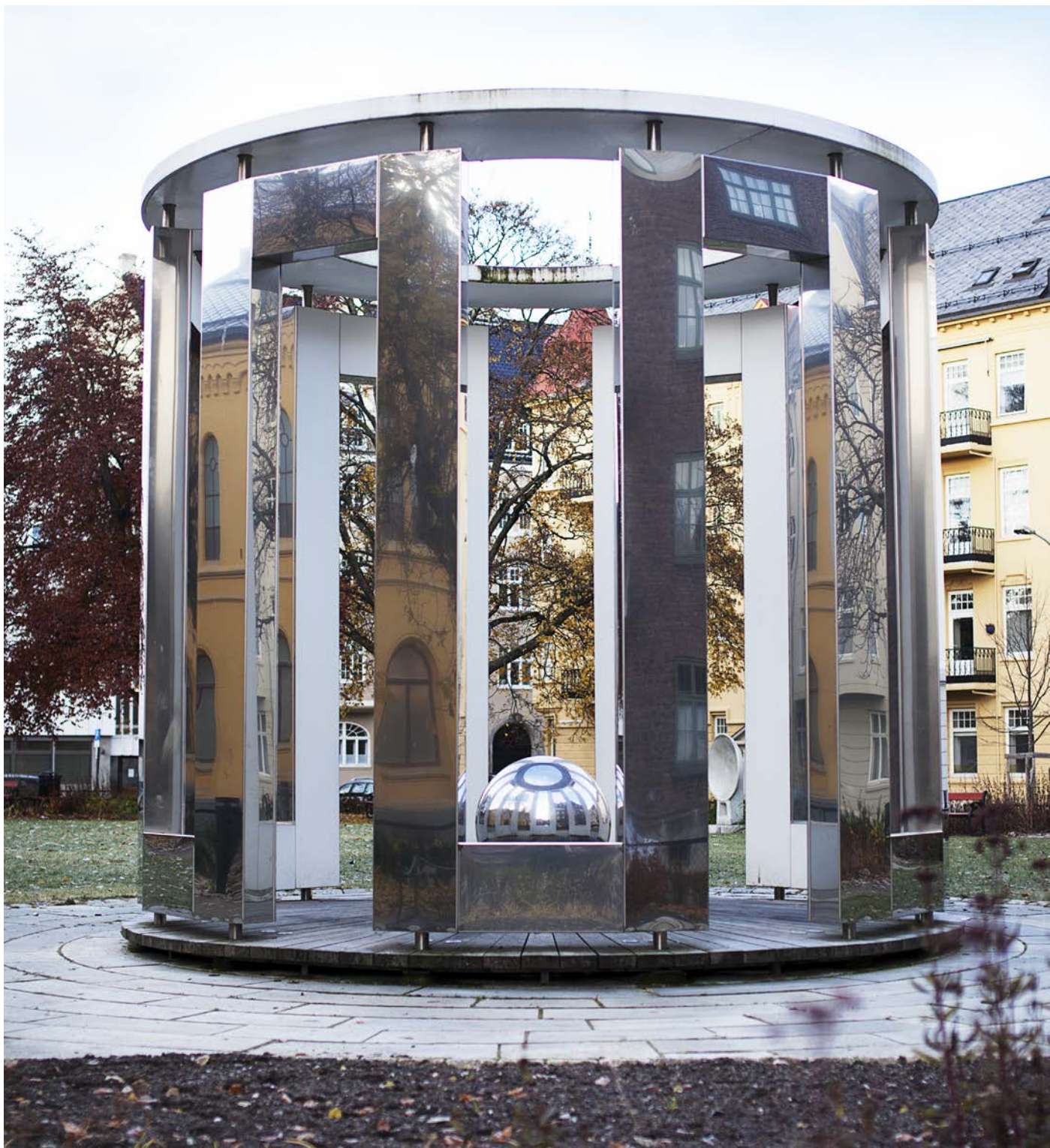
"Reflexions": Et kunstverk i Muesumsparken der det er rom for tanker og refleksjon, konstruert som et tempel fra antikken. Verket er laget av Mats Olofgörs og Torbjörn Johansson, 2010.

I dag tenkes det mer helhetlig, og samspillet mellom arkitektur, infrastruktur, kunst og kultur er med på å skape trivsel og gode opplevelser i Trondheim. Det er allerede laget flere bøker om temaet og prosjektet er godt kjent utenfor landets grenser. Prosjektet er tverrfaglig og omfatter blant annet byutvikling, de som drifter byen og kunstnerne selv.