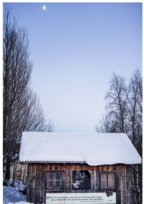
Bjørneboesitater: Rundt om i bygda Leveld er det lagt opp en runde med sitater av forfatteren Jens Bjørneboe.