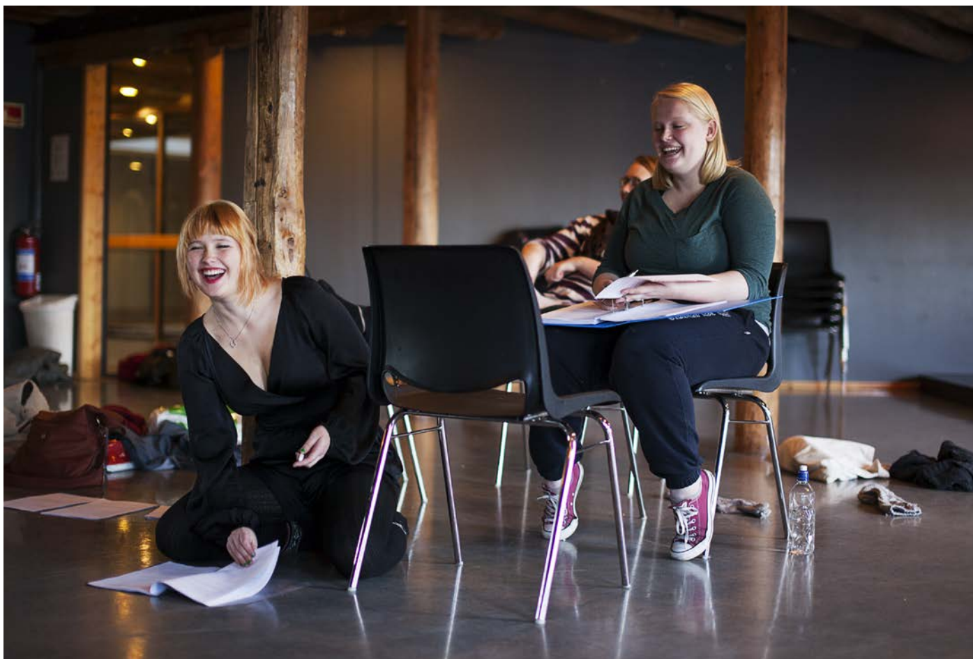
Innstudering: Studenter benytter seg av rommene på Kultursenteret ISAK til å øve på en teateroppsetning.

FARK samarbeider blant annet tett med Kultursenteret ISAK som også er en del av kulturenheten i Trondheim. Dette er det største og mest aktive kultursenteret for ungdom mellom 16 og 25 år i kommunen. Aktivitetene er basert på ungdommenes eget initiativ og man finner et mangfold av kulturuttrykk, kurs og arrangementer. ISAK kan blant annet tilby lydstudio, foto-studio og en liten kinosal.