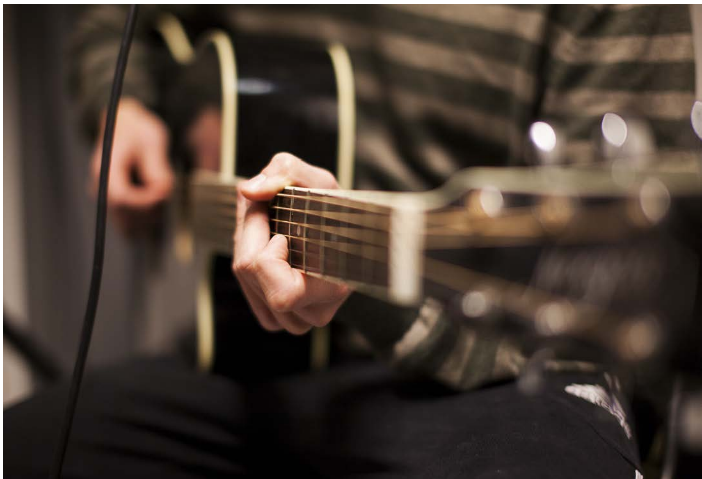
Bandøvelse: En vennegjeng møtes for å øve sammen noen ganger i uka.

FARK bistår arrangører, enten de er profesjonelle eller amatører, med alt fra rådgivning til praktisk arbeid.